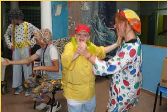
Clownterapia al centro di Brascine