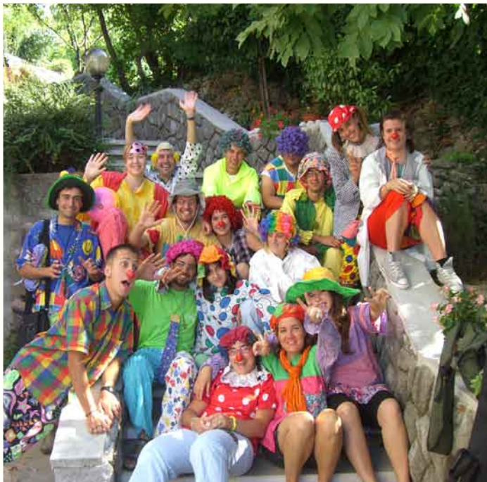
Il coloratissimo gruppo di Cloz (TN)