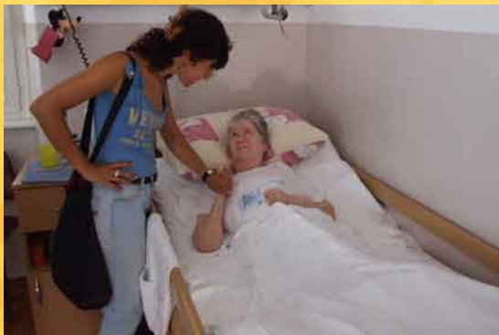
Con gli anziani di Veli Losinj