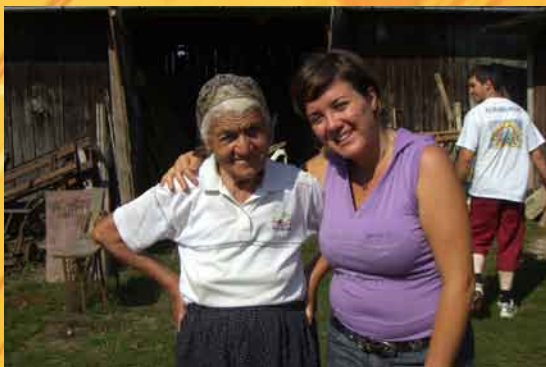
Betta con la "nonnina della montagna"