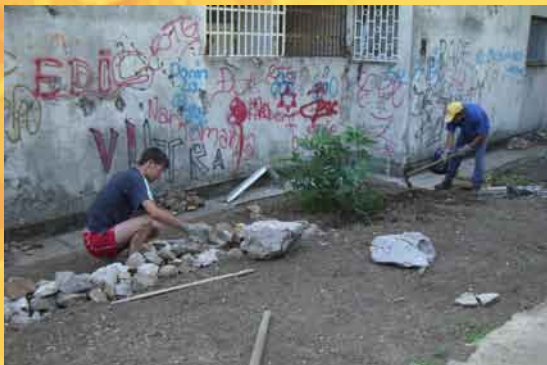
Si costruisce un giardino per i ragazzi del riformatorio di Lidija