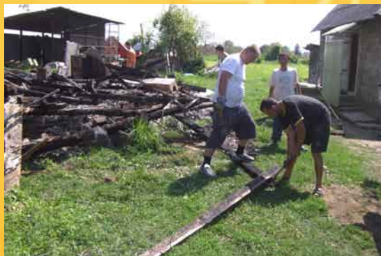
Ore e ore di duro lavoro per il progetto di Sisak