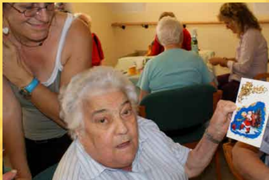
Un ponte per guardare oltre: al centro diurno per anziani di Rovereto