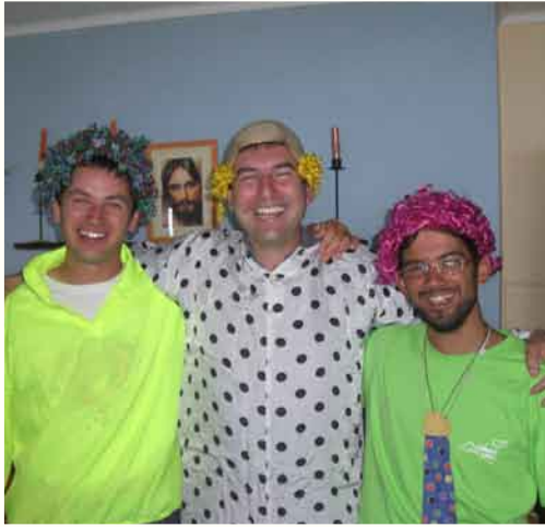
I magnifici tre di Cloz (più uno dietro, che è il Massimo)