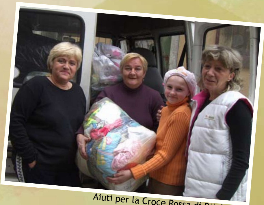
Aiuti per la Croce Rossa di Rijeka