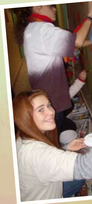
Murales al Dom z