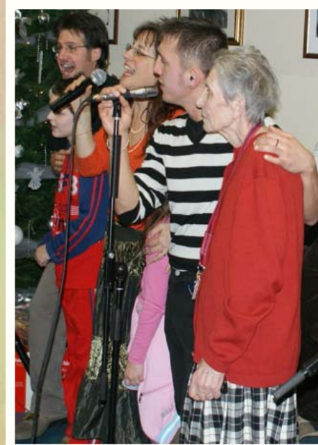
A Villa Serena di Bardolino (VR)